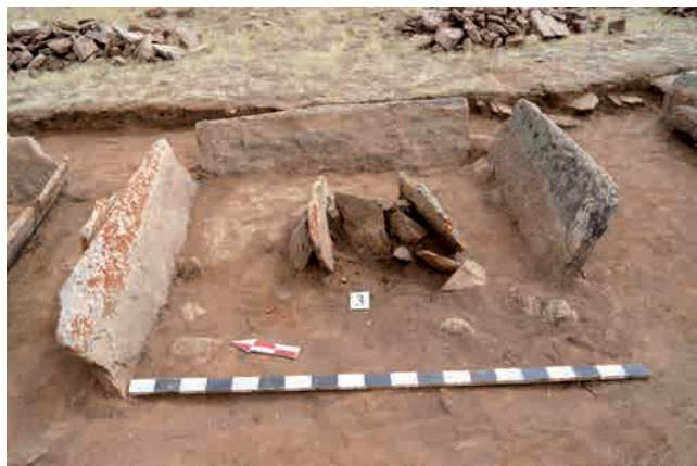
Рис. 3. Расчищенные остатки каменного ящичка в сооружении № 3.