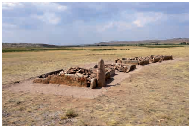
Рис. 5. Панорамный вид на реставрированные сооружения.