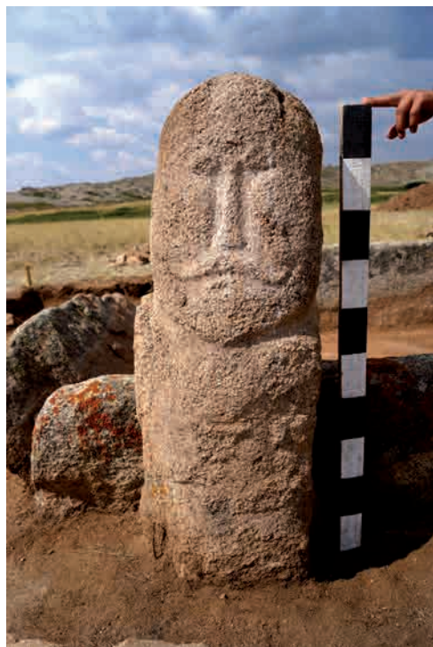
Рис. 4. Антропоморфное изваяние.

Сторонником компромиссного подхода является также Н. Н. Сере-