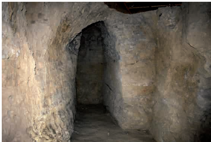
Сур. 3. Бурнооктябрьск. Қазба I, бөлме 3 Fig. 3. Burnooktyabrsk. Excavation 1, room 3