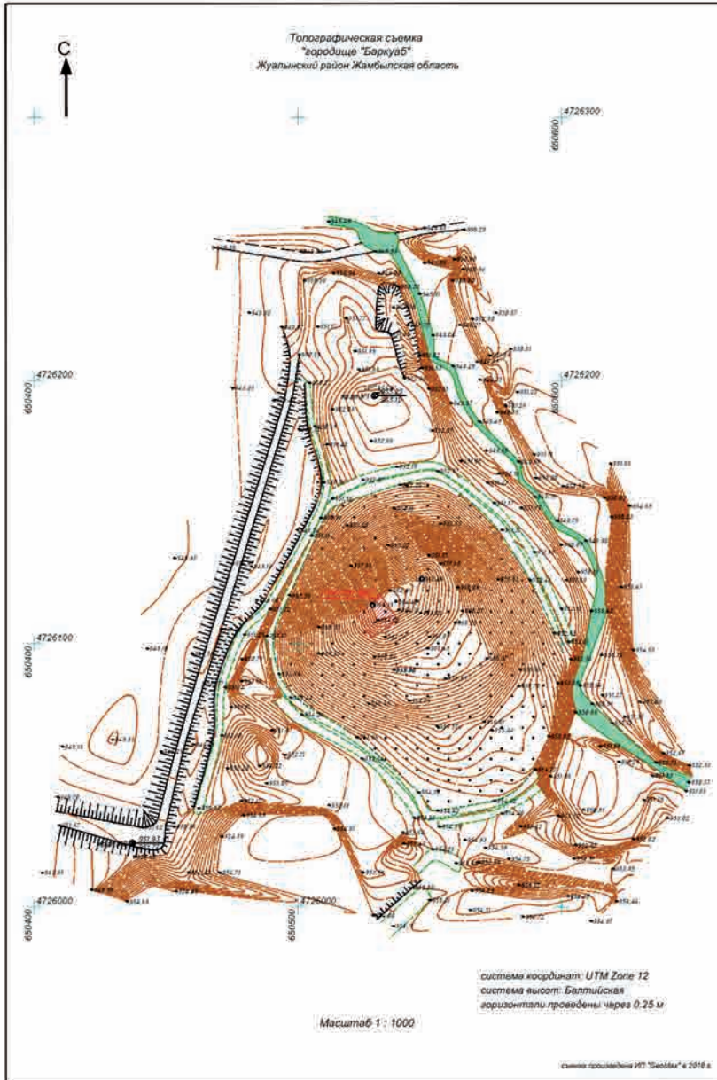
Сур. 1. Бурнооктябрьск. Ескерткіштің топографиялық жобасы Fig. 1. Burnooktyabrsk. Topographic plan of the monument

логиялық экспедициясы (К. Байпақов) Жуалы ауданындағы ескерткіштердің мемлекеттік тізімін жасау кезінде Теріс өзенінің жағасындағы Бурнооктябрьск қалашығының тарихи-топографиясы мен сипаттамасын