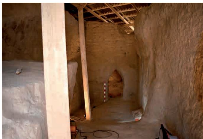
Сур. 2. Бурнооктябрьск. Қазба I, бөлме 1 Fig. 2. Burnooktyabrsk. Excavation 1, room 1