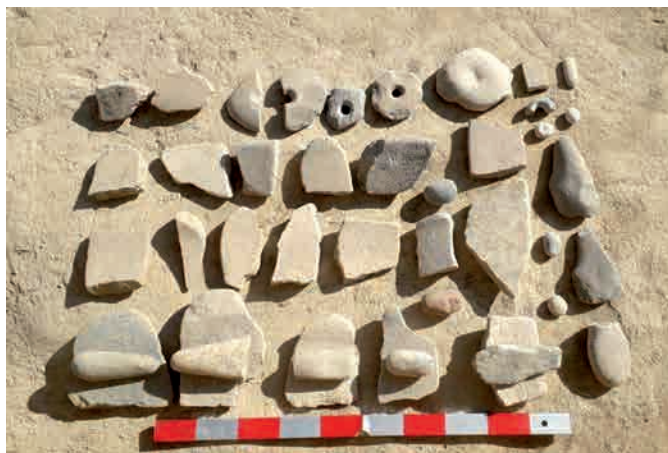
Сур. 7. Бурнооктябрьск. Тасан жасалған құралдар