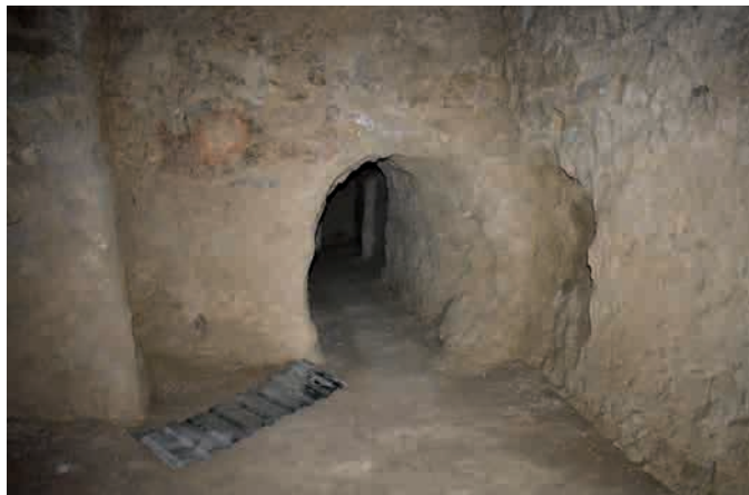
Сур. 4. Бурнооктябрьск. Қазба I, бөлме 5