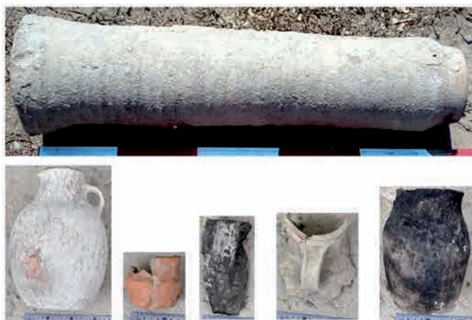
Сур. 6. Бурнооктябрьск. Керамика Fig. 6. Burnooktyabrsk. Ceramics

Қазбаның Батыс шетіндегі қабырғаның бойымен жердің бетінен 4,5 м, қабырғаның үстіңгі жағынан 3,5 м тереңдікке дейін қазылды. Оңтүстіктен солтүстікке қарай созылған 6 метрлік осы қабырғаның бетінде сырты күйе жалыннан қалған от іздері сақталған сылағы ір жерінде қалыпты. Қабырғаның шығыс шетінен 2 м кеңейтілген қазбаның ішінен ешқандай құрылыс іздері анықталмады. Топырақ және сынған кесек араласқан массамен толтырылған осы бет кешеннің жоғарғы қабатының сыртқы қабырғасының тыс бетіне ұқсас. Шама-сы кешен дәурен құрып тұрған кезде осы шығыс бет оның ауласы болған қас бетіне ұқсайды. Осы қабырғаның солтүстік шетінен жалғасып, шығысқа қарай бағытталған екінші қабырға 5 м кейін солтүстікке қарай бұрылады. Бұл қабырғаның тереңдігі де батыс қабырғамен бірдей. Тек екі қабырғаның бойы да тұтас, ешқандай есік қуысы жоқ болып шықты. Тек батыс қабырғаның оңтүстік бұрышы мен оның солтүстік қабырғамен түйіскен жерінен диаметрі 1 м бо-