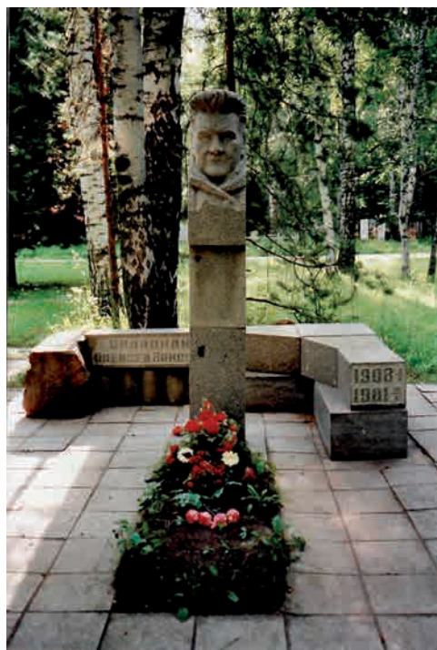
Рис. 8. Бюст А. П. Окладникова, установленный в г. Новосибирске.

Я благодарен судьбе за то, что она свела меня с Алексеем Павлови-