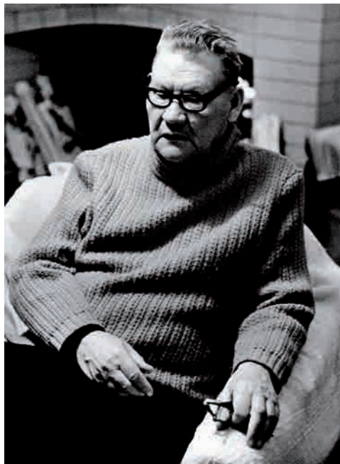
Рис. 1. Алексей Павлович Окладников. Одна из последних фотографий. 1981 г.